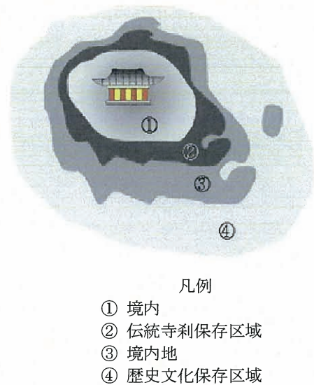
図4 伝統寺刹の保存区域の概念図

また、伝統寺刹として登録されると、法堂などの寺刹における施設物の老朽が甚だしい場合、国から補助金が支給される。その改・補修費の負担割合は国庫と自治体、所有者がそれぞれ4対4対2の比率である。補助金支援は1997年から始まり、最初は6ヶ所の寺刹に1億6,700万円、2003年には107ヶ所の寺刹に51億2,000万円、2004年には113ヶ所の寺刹に56億3,100万円、2005年には131ヶ所の寺刹に61億6,900万円、2006年には129ヶ所の寺刹に60億5,200万円、2007年には153ヶ所寺刹に91億3,200万円の支援があった(文化体育観光部『2007文化政策白書』、2008、p.365 参照)。しかし、伝統寺刹の登録状況からみると国庫補助金を受ける寺刹は韓国の全寺刹の0.5%にも至らないのが現実である。