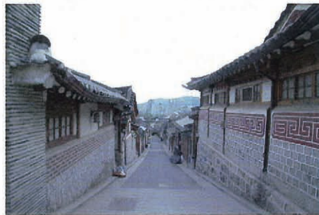
写真 1～3 北山韓屋保存地区風景