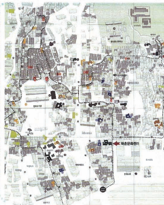
図2 北村韓屋保存地区(現況)